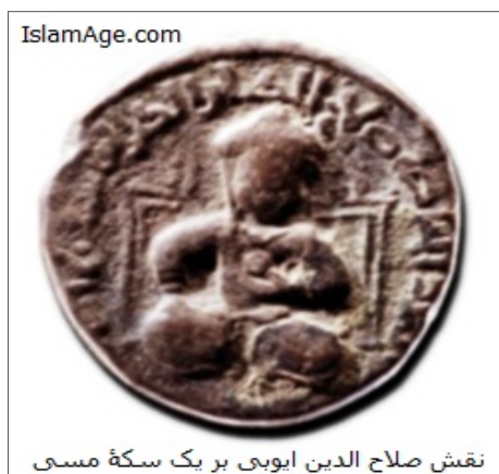
نقش صلاح الدین ایوبی بر یک سکه مسی

با رسیدن سپاهیان فرانسه و انگلستان آن ها توانستند سواحل و بنادر لبنان و فلسطین را از صلاح الدین بازپس گیرند اما در حمله به مصر و مناطق داخلی ناکام ماندند و نتوانستند به بیت المقدس حمله ببرند. در پایان ریچارد معاهده رمله را با صلاح الدین امضا نمود. بر اساس این معاهده زیارت بیت المقدس برای نصارا آزاد گردید و تاجران مسلمان نیز می توانستند در شهرهای تحت کنترل صلیبی ها به تجارت بپردازند.