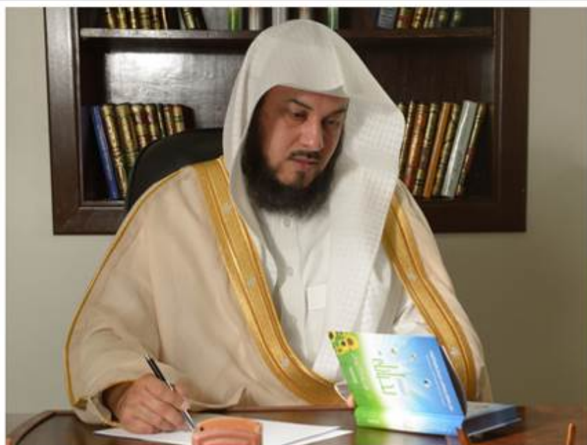
دکتر محمد بن عبدالرحمن العریفی