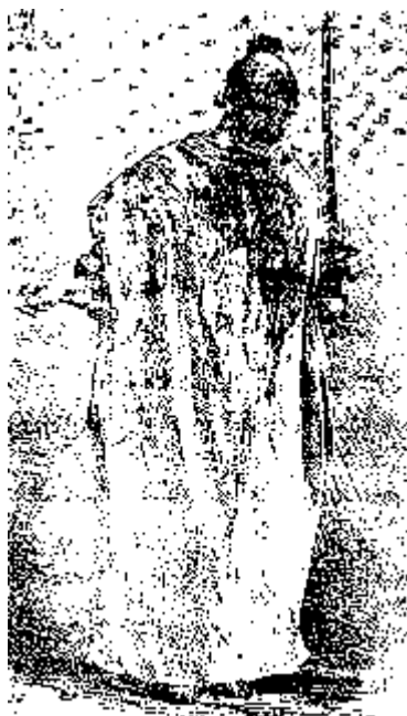
یک تن از قمه زنان

آغازیده چنین گفتند: «پس فرنگی‌ها امام حسین را می‌شناسند و شما نمی‌شناسید، ای بی‌دین‌ها؟!». این را گفته به تکان آمدند.