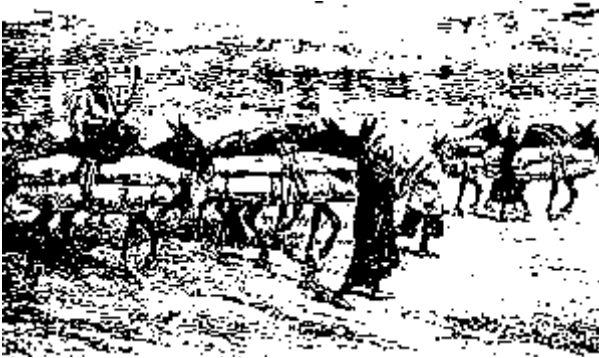
استخوان‌های مردگان را بار کرده به کربلا می‌برند

این کار را چرا می‌کنند؟!... به آن استخوان‌ها چه کاری هست که از این شهر به آن شهر می‌کشند؟!... اگر از خودشان بپرسید یکی خواهد گفت: یک در بهشت از کربلا یا از نجف یا از قم است، و مرده‌ای که در آنجا خوابیده همان که بوق دمیده شود و برخیزد یکسره به بهشت خواهد رفت. دیگری خواهد گفت: مرده‌ای را که در قوطی گزاردند و به نجف یا به کربلا خواهد رفت از فشار گور ایمن باشد. دیگری خواهد گفت: ما گناهکاریم و به آن آستان پناهنده می‌شویم. یا خواهد گفت: ما سگیم و خود را به نم‌کزار می‌اندازیم.