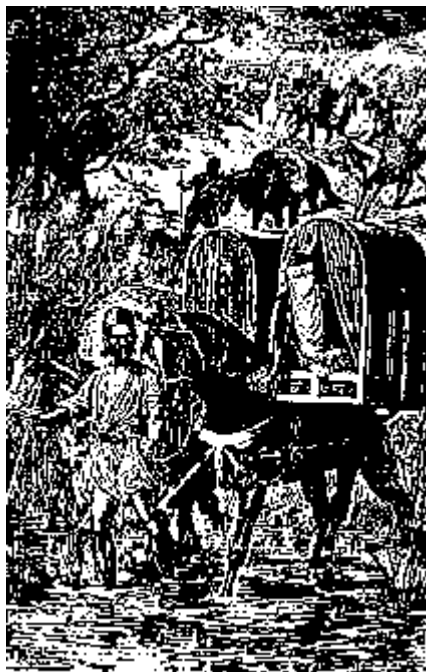
زن ایرانی به زیارت کربلا می‌رود

هفتم: آن بارگاه‌ها که در مشهد و قم و عبدالعظیم و بغداد و سامره و کربلا و نجف و دیگر شهرهاست و شیعیان به زیارت روند خود جداگانه داستانیست.