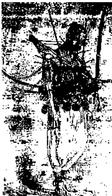
یک تن قفل به تن

یک تن قفل به تن این که از صد سال باز اروپاییان که به ایران و هند آمده‌اند داستان‌ها از این نمایش‌ها و نادانی‌های شیعیان در کتاب‌هاشان نوشته‌اند و پیکره‌ها برداشته به چاپ رسانیده‌اند (۱) ، این که برخی شرق‌شناسان به ستایش‌هایی از شیعیگری و از این نمایش‌ها پرداخته‌اند، همه از این راه بوده است.